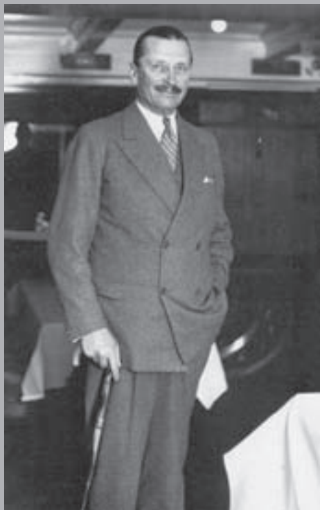
Маршал Финляндии Карл Густав Маннергейм. Кон. 1940-х

Премьер-министр Финляндии в 1932–1936 гг. Т. М. Кивимяки и лидер социал-демократов Вяйнё Таннер в кафе эдускунты (парламента Финляндии). Хельсинки. Середина 1930-х