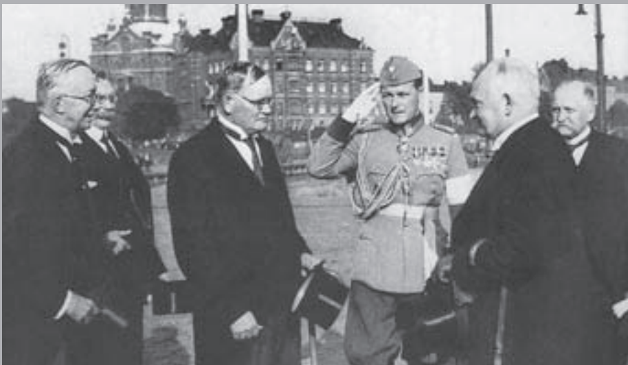
Министр иностранных дел Финляндии Р. Холсти, премьер-министр Финляндии А. Каяндер, председатель эдускунты В. Хаккила, адъютант Слёён, Государственный старейшина Эстонии (глава государства) К. Пятс, президент Финляндии К. Каллио. Хельсинки. 1937