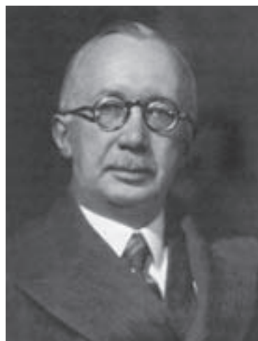
Министр иностранных дел Финляндии в 1919–1922 и 1936–1938 гг. Рудольф Холсти. 1937