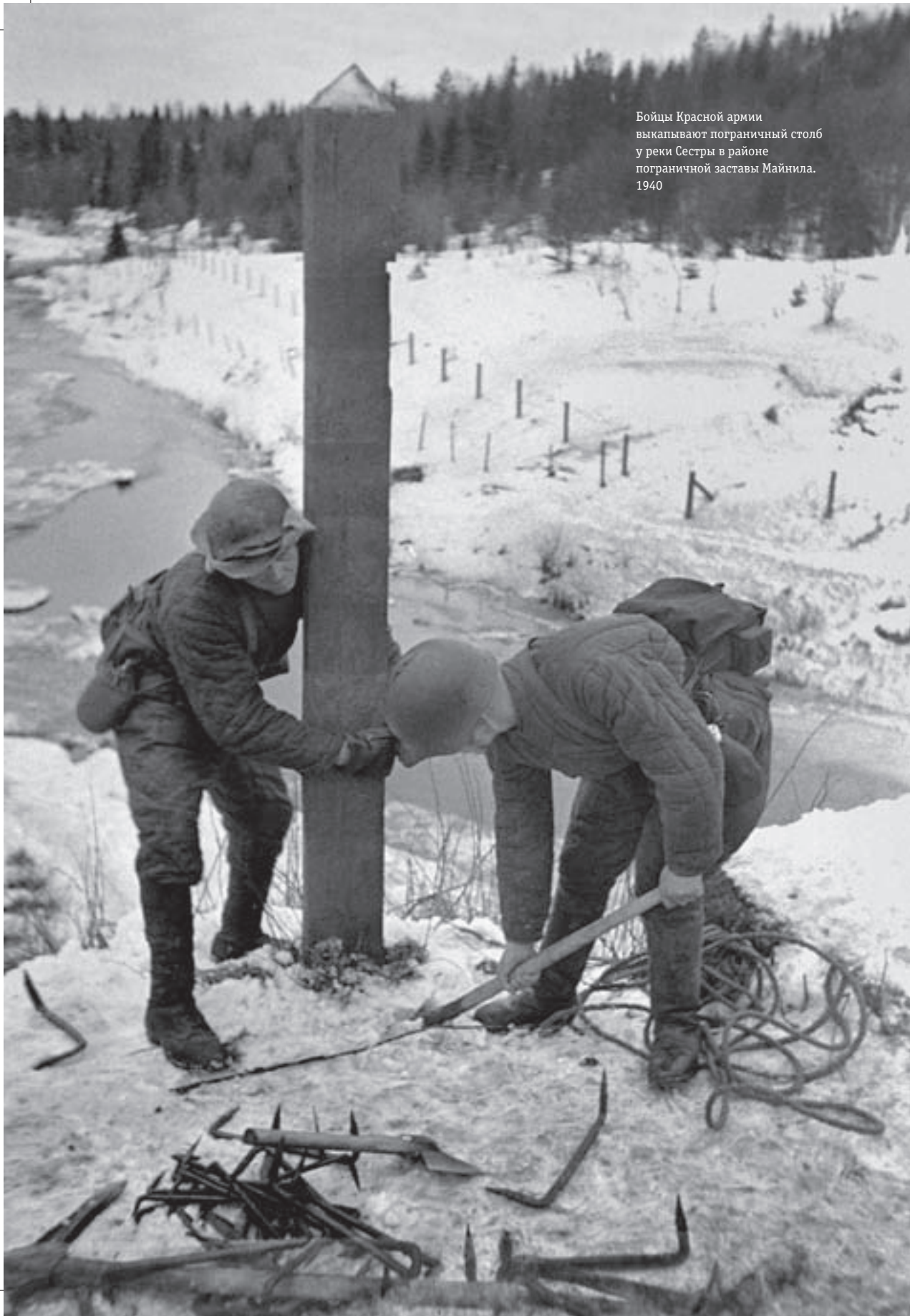
Бойцы Красной армии выкапывают пограничный столб у реки Сестры в районе пограничной заставы Майнила. 1940