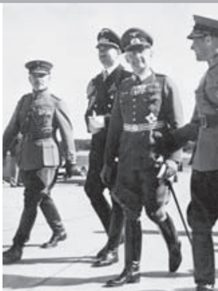
Генерал вермахта Франц Гальдер (второй справа) и германский посланник в Финляндии Виперт фон Блюхер (второй слева). Хельсинки. 1939