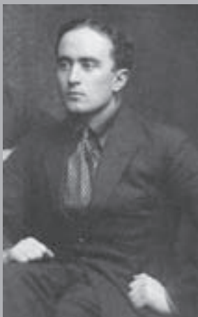
Один из основателей Карельского Академического общества Лаури Элиас Симойоки. Нач. 1930-х