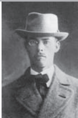
Первый председатель Карельского Академического общества Эльмо Кайла 1930-е