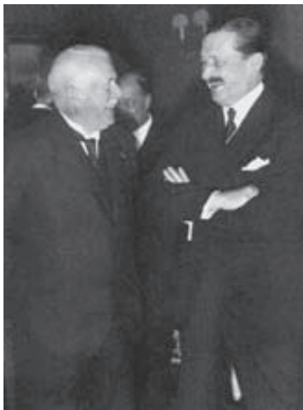
Генерал вермахта Рюдигер фон дер Гольц и маршал Финляндии Карл Густав Маннергейм. 1938